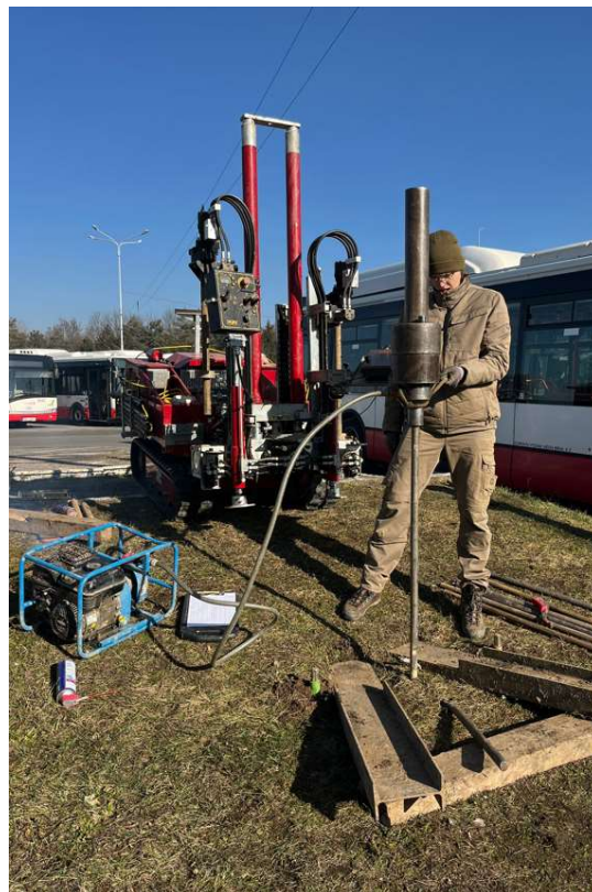
Foto 8: Realizace dynamické penetrace u statické penetrační zkoušky CPTu 1.