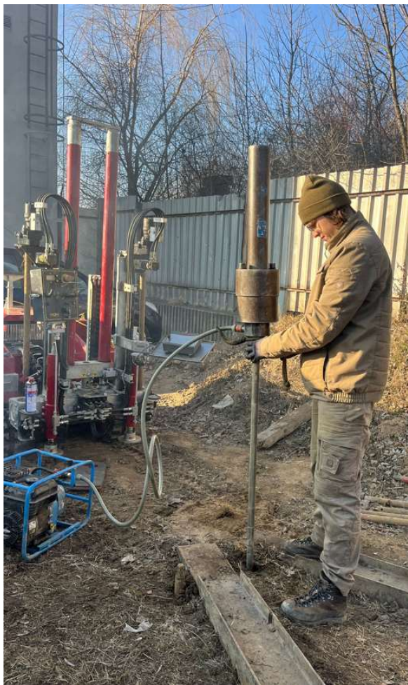
Foto 11: Realizace dynamické penetrace u statické penetrační zkoušky CPTu 2b.